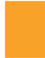
1/1 210 x 297 mm 185 x 270 mm + Beschnitt (3mm)