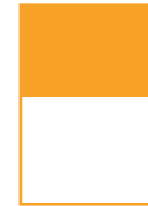
1/2 185 x 130 mm 90 x 270 mm