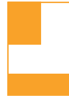
1/4 185 x 60 mm 90 x 130 mm